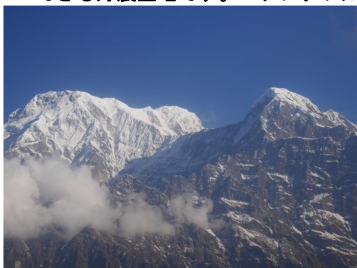
アンナプルナサウス、ヒウンチュリ (High Camp より)

日 程 ：平成 29 年 11 月 13 日 (月) ~ 28 日 (火) 予定 コース ：アンナプルナ山域 マルディ・ヒマール ムンダイ・ヒル コース