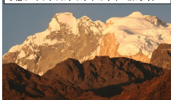
夕陽の アンナプルナI峰 (ムンダイ・ヒルより)

公立小学校を訪れます。 日本から持参する子供服、 文房具、遊び道具、ボールなどを 届け、半日児童と一緒に過ごしま す