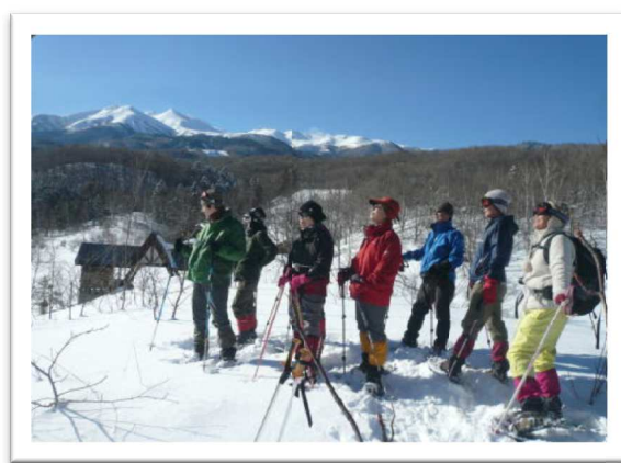
【スノーシューハイク】