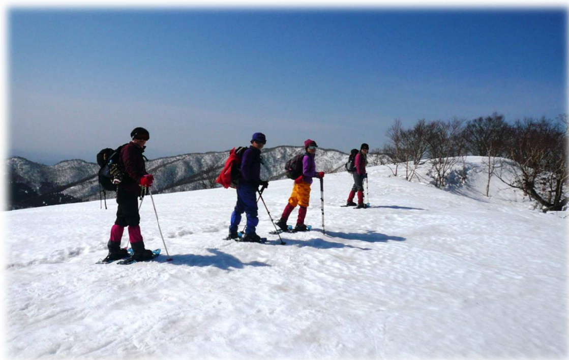
【スノーシューで雪山を楽しむ】

静岡県山岳連盟が初心者を対象に雪山登山教室を開催致します。正しい雪山知識を身につけスノーハイクを楽しみましょう。