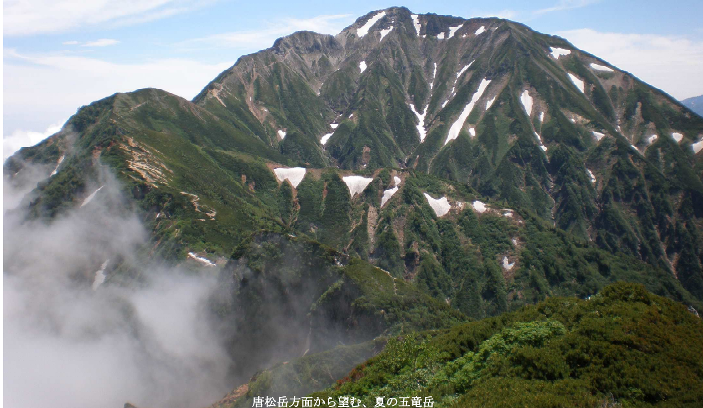
唐松岳方面から望む、夏の五竜岳

静岡県山岳連盟主催の夏山登山教室、4 回目の今年は北アルプスの五竜岳 (2814m) と唐松岳 (2696m) を目指します。五竜岳は日本百名山の一つ、力強く男性的な山容で、後立山連峰の中央に聳えています。山頂では、剣・立山連峰への素晴らしい大展望があなたを待っています。