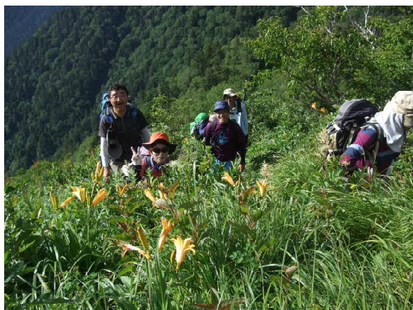
ニッコウキスゲの大群落がありました。