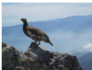
雷鳥と出逢いました。