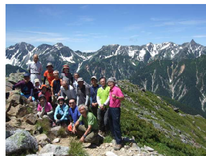
昨年は常念岳でした。

全くの初心者でも大丈夫。県岳連所属山岳会のベテランがご案内します。あなたも行ってみませんか。五竜岳へ。